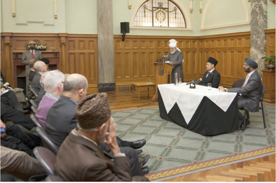
حضور انور ایدہ اللہ تعالیٰ نیوزی لینڈ پارلیمنٹ کے گریڈ ہال میں خطاب فرما رہے ہیں