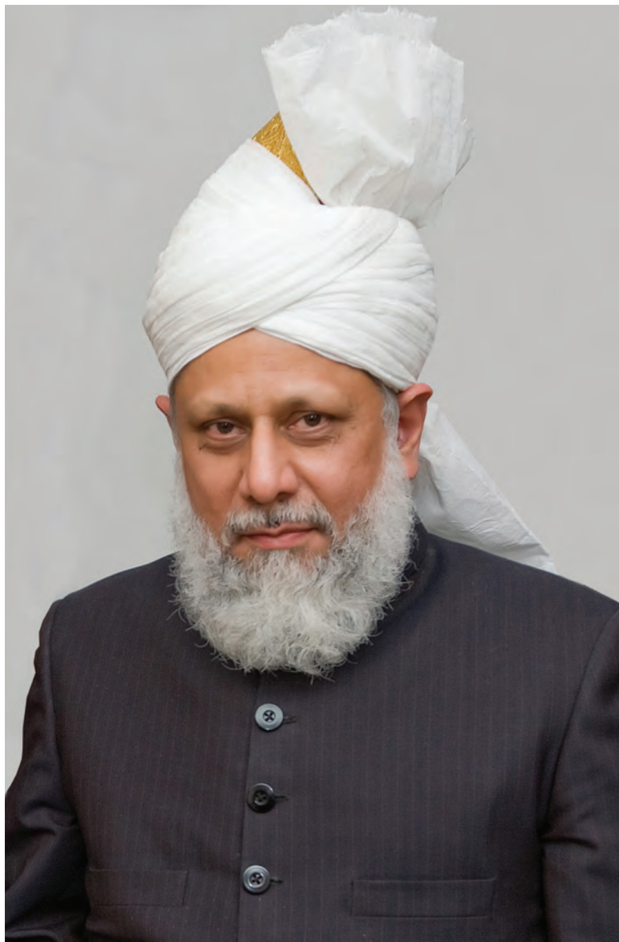
حضرت مرزا مسرور احمد خلیفۃ المسیح الخامس ایدہ اللہ تعالیٰ بنصرہ العزیز