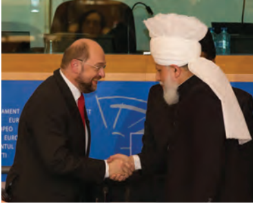
یورپی پارلیمنٹ کے صدر مارٹن شٹلز حضور انور کو خوش آمدید کہتے ہوئے