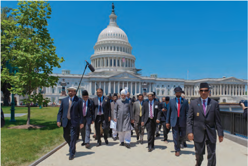
حضرت مرزا مسرور احمد خلیفہ المسیح الخامس ایدہ اللہ تعالیٰ بنصرہ العزیز کیمپبل بل ریاست ہائے متحدہ امریکہ میں امریکی عمائدین اور افسران سے خطاب کے بعد