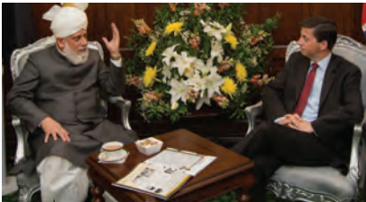
شیئر و فارن منسٹر جناب ڈگلس الیکزینڈر نے حضرت خلیفۃ المسیح الخامس ایده اللہ تعالیٰ بنصرہ العزیز کے ساتھ ملاقات کا شرف حاصل کیا