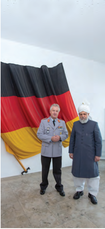
جرمنی میں وفاق کی فوج کے بریگیڈیئر جنرل الوکس باخ حضرت خلیفۃ المسیح الخامس ایدہ اللہ تعالیٰ بنصرہ العزیز کے ہمراہ