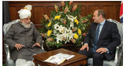
جناب ایڈووکیٹ ایم بی حضرت خلیفۃ المسیح الخامس ایده اللہ تعالیٰ بنصرہ العزیز کے ساتھ ملاقات کا شرف حاصل کرتے ہوئے