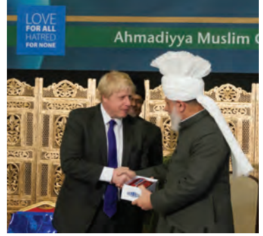
لندن کے میئر بورس جانسن حضرت اقدس کی خدمت میں لندن بس کا سوونیز پیش کرتے ہوئے