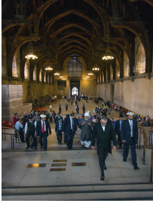
جناب ایڈیوٹی ایم بی حضرت خلیفۃ المسیح الخامس ایدہ اللہ تعالیٰ بنصرہ العزیز کو ہاؤس آف کامنز کے مغربی ہال کی طرف لے جا رہے ہیں جون 2013ء