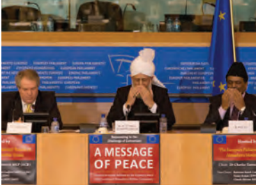
یورپی پارلیمنٹ میں تقریب کے اختتام پر حضور انور دعا کروا رہے ہیں آپ کے دائیں طرف برطانیہ سے یورپی پارلیمنٹ کے رکن ڈاکٹر چارلس ٹانک اور بائیں طرف امیر جماعت برطانیہ بیٹھے ہیں