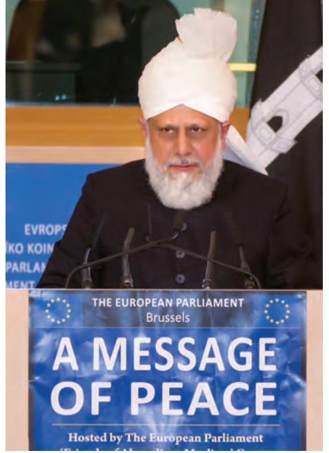
حضرت مرزا مسرور احمد غلہ پتہ المسیح الخامس ایدہ اللہ تعالیٰ بنصرہ العزیز یورپین پارلیمنٹ سے خطاب فرما رہے ہیں