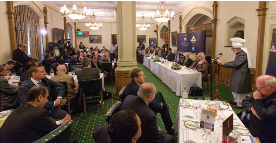
حضرت خلیفۃ المسیح الخامس ایدہ اللہ تعالیٰ بنصرہ العزیز لندن کے ہاؤس آف کامنز میں ممبران پارلیمنٹ وی آئی پی شخصیات اور ڈپلومیٹس سے تاریخی خطاب فرما رہے ہیں