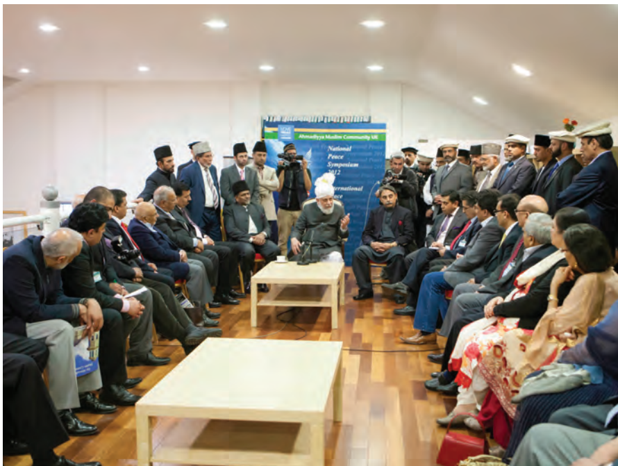
حضرت مرزا مسرور احمد خلیفۃ المسیح الخامس ایدہ اللہ تعالیٰ بنصرہ العزیز سمندر پار پاکستانی پریس سے عالمی امور پر گفتگو کرتے ہوئے