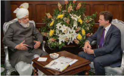
نائب وزیر اعظم جناب نیک کلینگ ہاؤس آف کامنز لندن میں حضور انور سے محو گفتگو ہیں