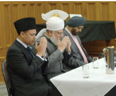
نیوزی لینڈ پارلیمنٹ کے گریڈ ہال میں سرکاری تقریب کے اختتام پر حضوراً نورایدہ اللہ تعالیٰ بصرہ العزیز دعا کروا رہے ہیں