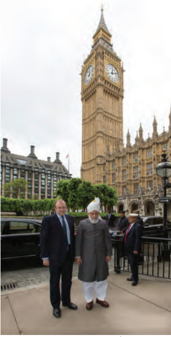
حضرت خلیفۃ المسیح الخامس ایدہ اللہ تعالیٰ بنصرہ العزیز ہاؤس آف کامنز کے باہر ایڈیوٹی ایم بی کے ساتھ کھڑے ہیں لندن 11 جون 2013ء