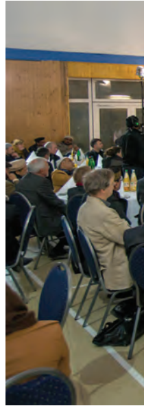
حضرت مرزا مسرور احمد غلپینہ کی مسیح الخامس ایڈہ اللہ تعالیٰ بنصرہ العزیز مسجد بیت الرشید میں خطاب فرماتے ہوئے