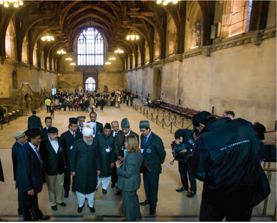
جسٹن گریننگ ایم پی کے ہمراہ برطانیہ کے ایوان زیریں میں حضور کا تقارنی دورہ