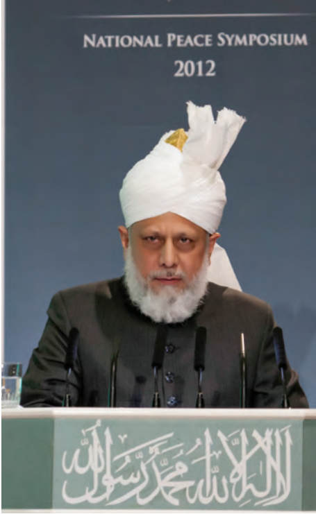
حضرت مرزا مسرور احمد خلیفۃ المسیح الخامس ایدہ اللہ تعالیٰ بنصرہ العزیز نویں سالانہ امن کانفرنس سے خطاب فرماتے ہوئے