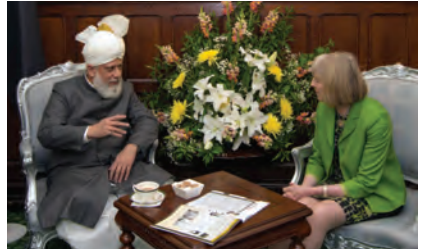
ہوم سیکریٹری محترمہ تھریساے حضرت خلیفۃ المسیح الخامس ایده اللہ تعالیٰ بنصرہ العزیز کے ساتھ گفتگو کا شرف حاصل کر رہی ہیں