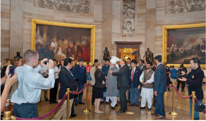
حضرت مرزا مسرور احمد خلیفہ المسیح الخامس ایدہ اللہ تعالیٰ بنصرہ العزیز کا کیمپبل بل کا دورہ