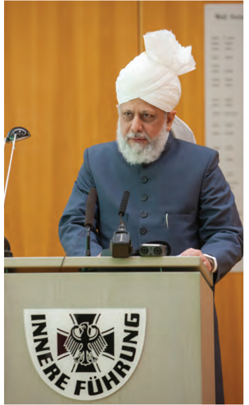
حضرت خلیفۃ المسیح الخامس ایدہ اللہ تعالیٰ بنصرہ العزیز جرمنی میں وفاق کی فوج سے خطاب فرماتے ہوئے