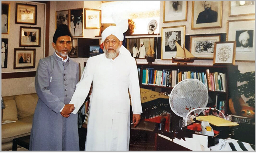
حضرت خلیفۃ المسیح الرابع رحمہ اللہ تعالیٰ کا پر شفقت ساتھ