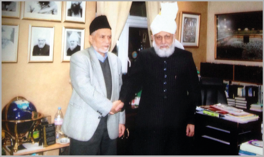
حضرت خلیفۃ المسیح الخامس ایدہ اللہ تعالیٰ بنصرہ العزیز کے بابرکت سائے میں