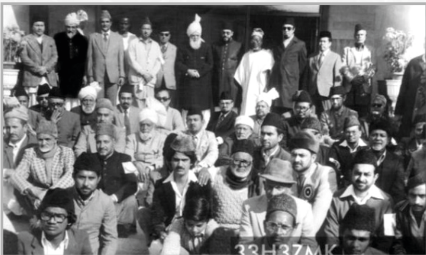
حضرت خلیفۃ المسیح الثالث رحمہ اللہ تعالیٰ کے ساتھ جلسہ سالانہ 1974 کے موقع پر گروپ فوٹو میں