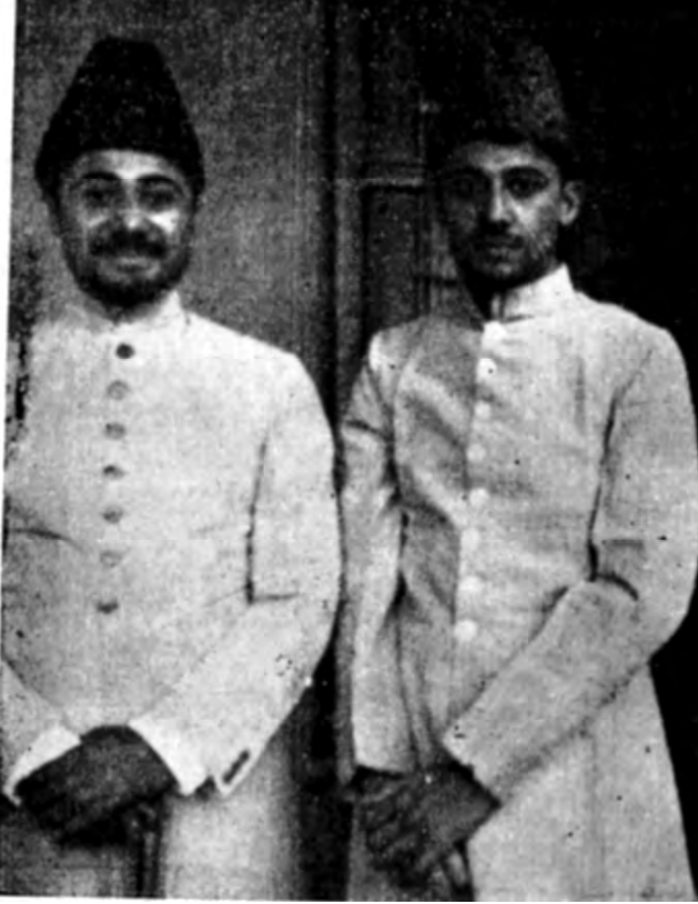
صاحبزادگان حضرت مصلح موعودؑ حضرت مرزا ناصر احمد صاحب اور حضرت مرزا مبارک احمد صاحب کے 1938 میں مصر میں قیام کے دوران لی گئی ایک تصویر