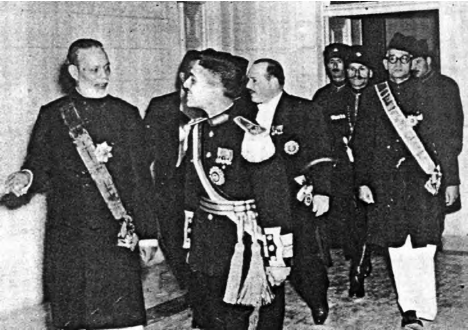
شاہ اردن کی طرف سے تمغہ دیئے جانے کے بعد کا ایک منظر