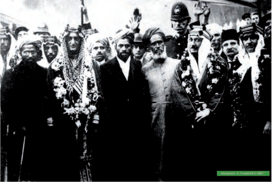
مولانا عبدالرحیم درد صاحب شہزادہ فیصل اور انکے وفد کا پیدنگٹن ریلوے سٹیشن (لندن) پر 1924 میں استقبال کرتے ہوئے