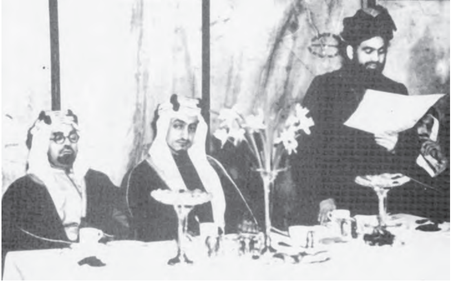
شہزادہ فیصل مسجد فضل لندن میں