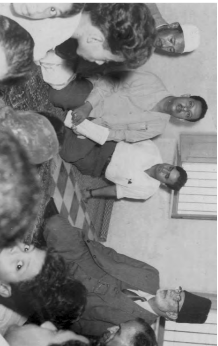
حضرت چوہدری محمد ظفر اللہ خان صاحبؒ افرادِ جماعتِ یمن کے درمیان