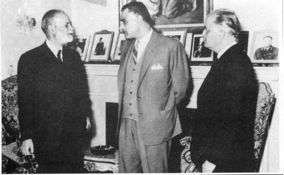
حضرت چوہدری محمد ظفر اللہ خان صاحب مصر کے صدر جمال عبدالناصر سے جو گفتگو ہیں