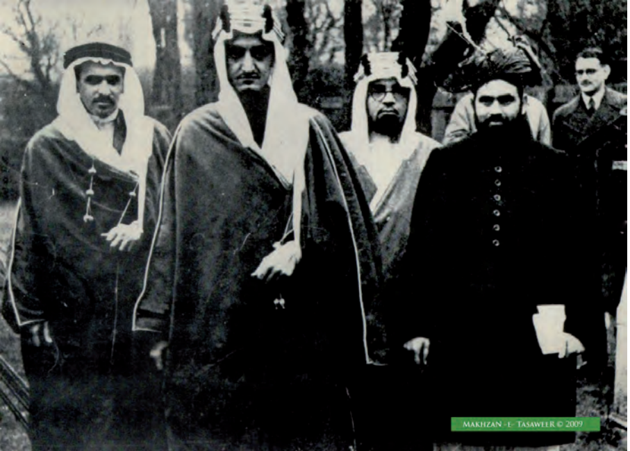
مولانا جلال الدین شمس صاحب 1939 میں شہزادہ فیصل کو مسجد فضل لندن خوش آمدید کہتے ہوئے