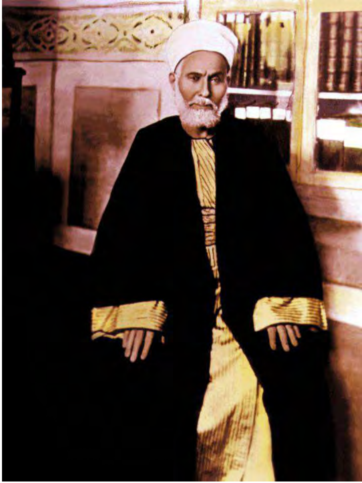
مصر کے مشہور صوفی بزرگ محمد ماضی ابوالعزائم