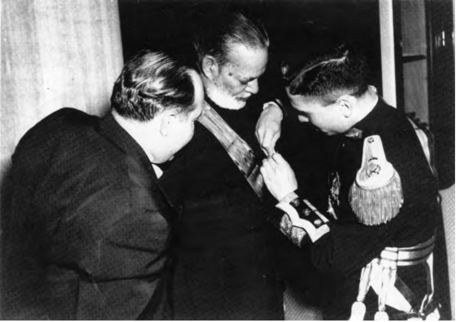
اردن کے شاہ حسین حضرت چوہدری صاحب کو تمغہ پہناتے ہوئے