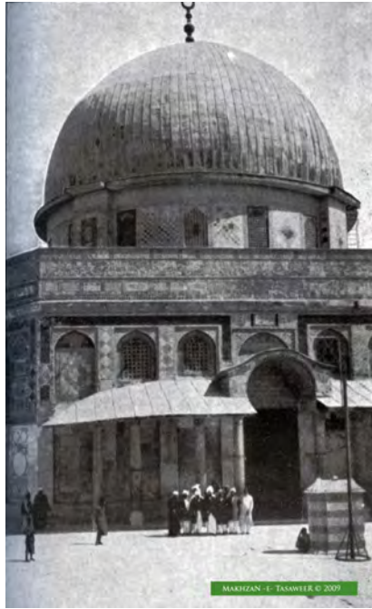
دورہ یورپ کے دوران القدس الشریف کی زیارت کے موقعہ پر لی گئی ایک تصویر