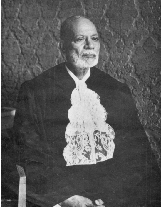
حضرت چوہدری محمد ظفر اللہ خان رضی اللہ عنہ صدر عالمی عدالت انصاف