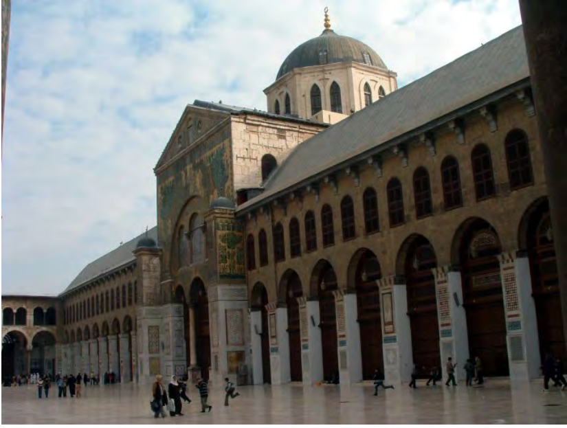
جامع اموی کا ایک منظر