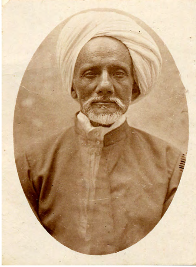
حضرت سیٹھ ابوبکر یوسف صاحب رضی اللہ عنہ