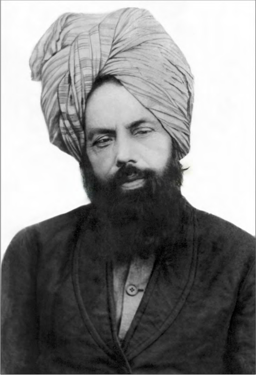
سیدنا حضرت مرزا غلام احمد قادیانی علیہ السلام مسیح موعود و امام مہدی