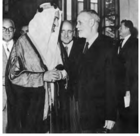
سعودی عرب کے شاہ فیصل کے ساتھ