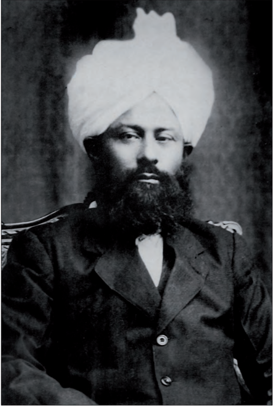
حضرت مرزا بشير الدين محمود احمد خليفة المسيح الثاني رضی اللہ تعالیٰ عنہ