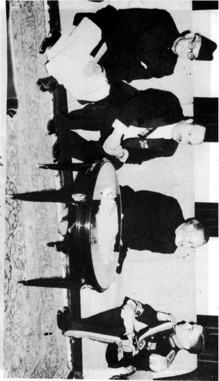
حضرت چوہدری محمد ظفر اللہ خان صاحبؒ اردن کے شاہ حسین کے ساتھ میٹنگ کے دوران