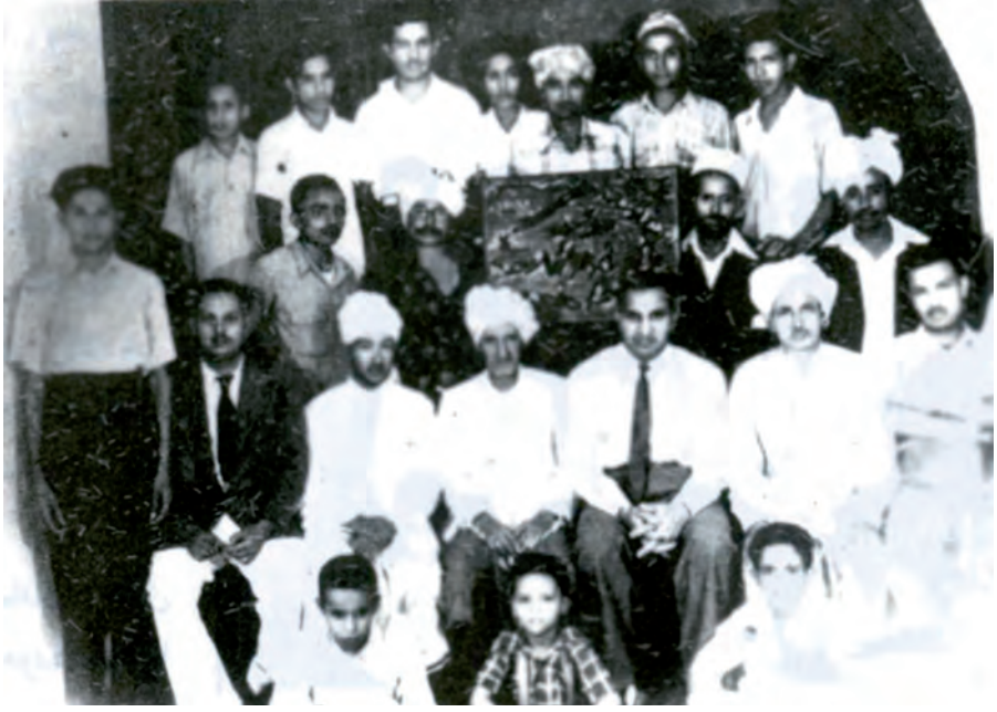
افرادِ جماعت احمدیہ یمن کی ایک پرانی تصویر