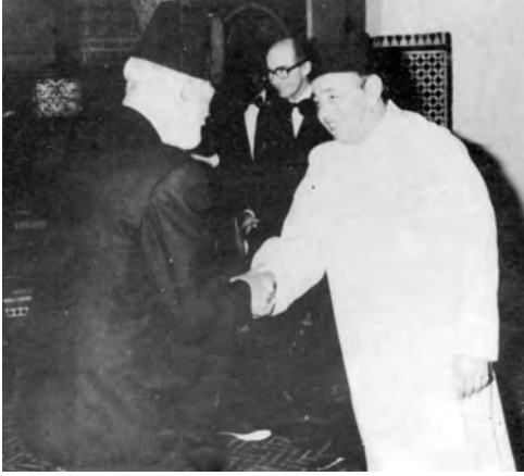
مراکش کے شاہ حسن ثانی کے ساتھ