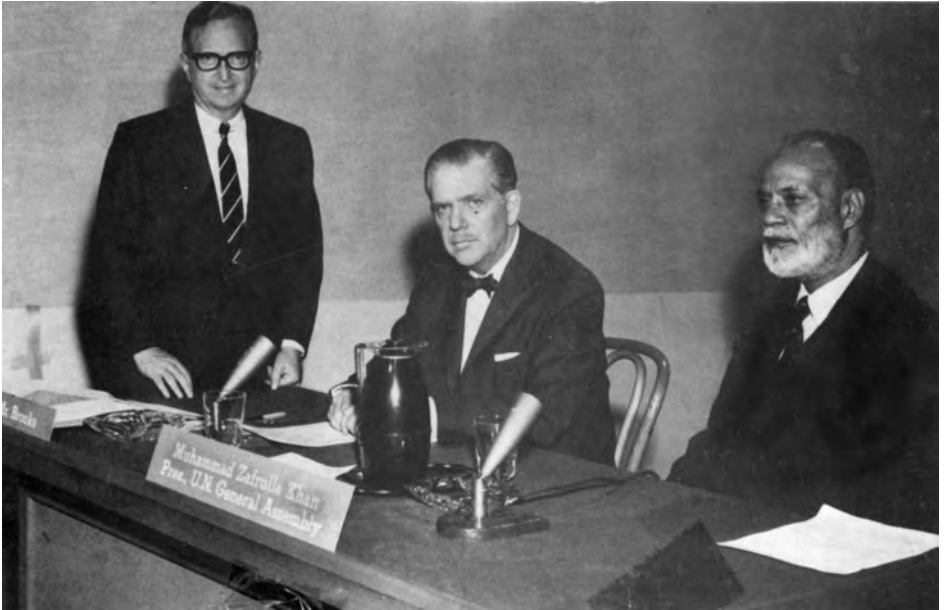
حضرت چوہدری محمد ظفر اللہ خان صاحب جنرل اسمبلی کے سترھویں اجلاس کی صدارت