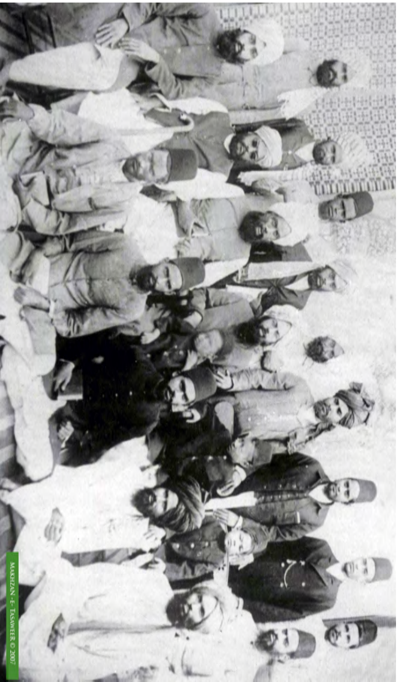
MAKHAZAN - E- TASAWWUF © 2007

حضرت مسیح موعود علیہ السلام اپنے صحابہ کے درمیان تشریف فرما ہیں، حضرت عبد اللہ العرب الہبؓ کے پیچھے کوڑے ہوئے صحابہ کرام میں دائیں سے دوسرے نمبر پر ہیں۔