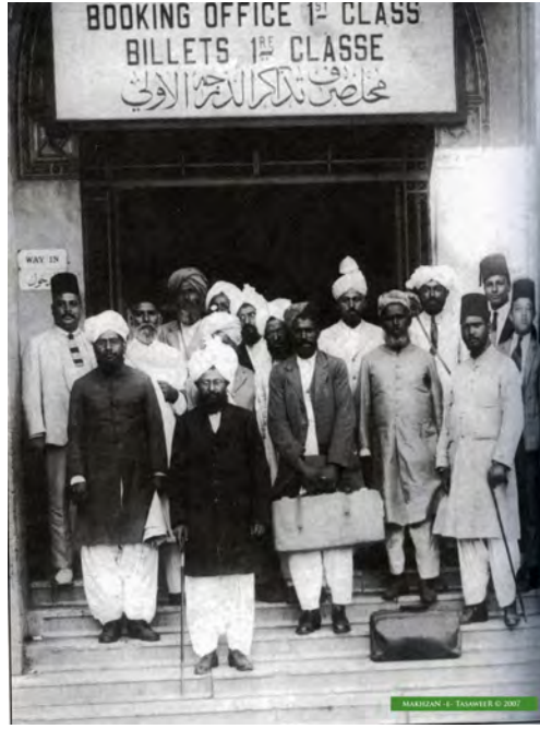
دورہ یورپ کے دوران مصر کے ایک ریلوے سٹیشن پر تصویر