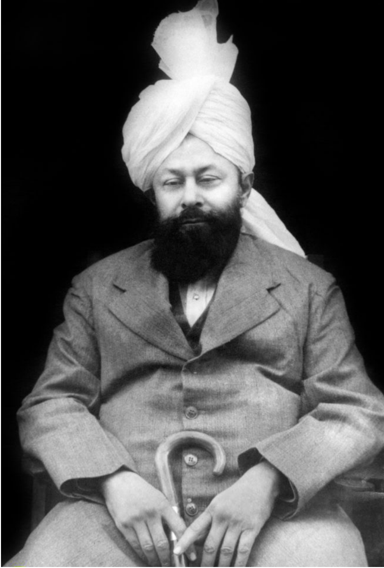
حضرت مرزا بشير الدين محمود احمد المصلح الموعود خليفة المسيح الثاني رضى الله عنه