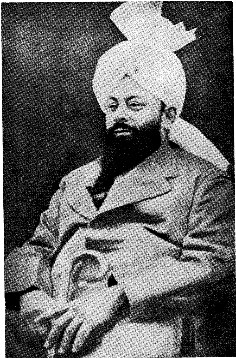
حضرت مرزا بشیر الدین محمود احمد صاحب الامم جماعت احمدیہ ائذی اللہ تعالیٰ