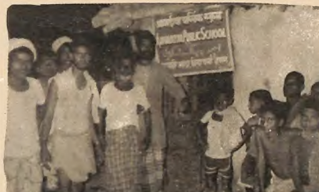
(۱) نازید اللہ کے بعد احباب جماعت مسجد اجیرہ پرسونی نیپال میں مقامی مبلغ کے ہمراہ (۱۹۹۳ء)

تعالیٰ مخالفین کے ہر شر سے محفوظ رکھے۔ احباب جماعت کے حوصلے بلند ہیں۔ خدا تعالیٰ ہم سب کو سچے رنگ میں اسلام اور انسانیت کی خدمت کی توفیق دیتا چلا جائے۔ آمین