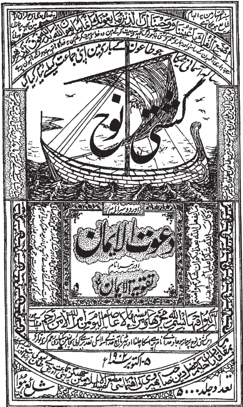
Facsimile of the original Urdu title page printed in 1902