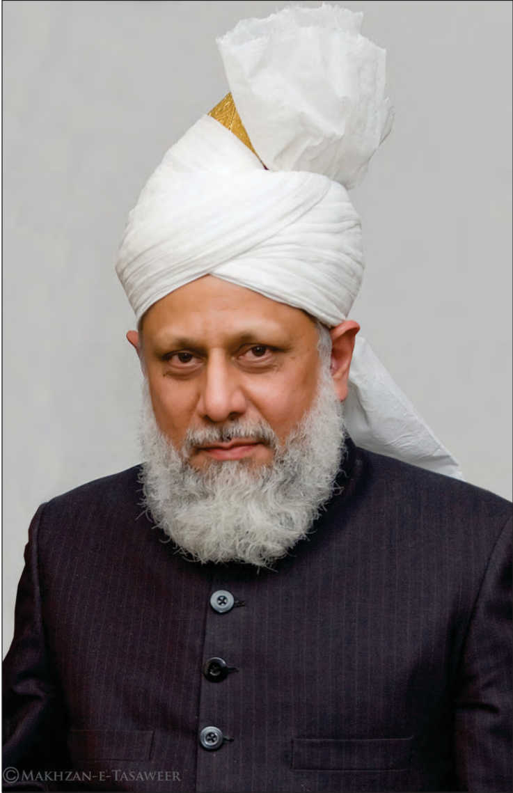
హజ్రత్ మిర్జా మసూద్ అహ్మద్ ఖలీఫతుల్ మసీహుల్ ఖామిస్ అయ్యుద్దహుల్లాహు తాలా బినసైహిల్ అజీజ్