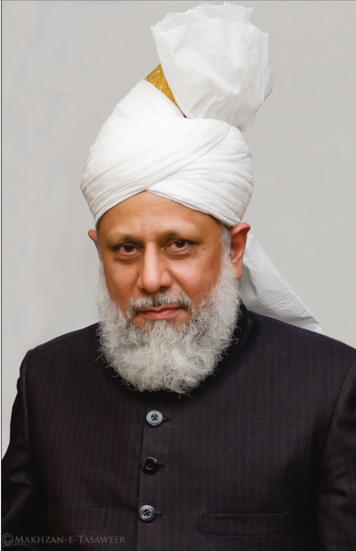
ହଜରତ ମିର୍ଜା ମସରୁର ଅହମଦ ଅବ ଖଲିଫତୁଲ ମସିହ ପଞ୍ଚମ