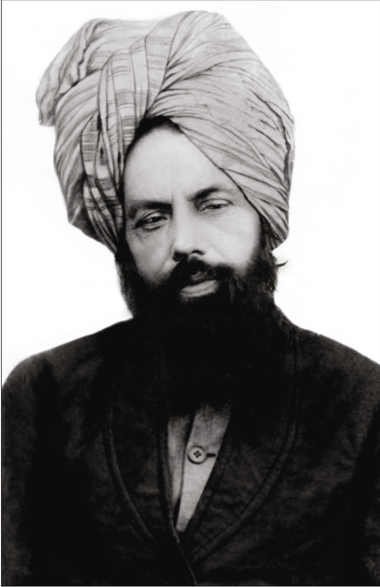
ହଜରତ ମିର୍ଜା ଗୁଲାମ ଅହମଦ ଅଷ୍ଟ