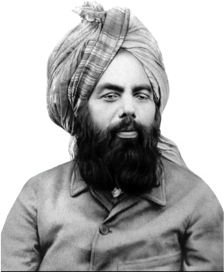
Hazrat Mirza Ghulam Ahmad of Qadian The Promised Messiah & Mahdi (peace be upon him)