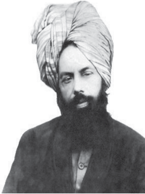
Promised Mahdi Maseeh