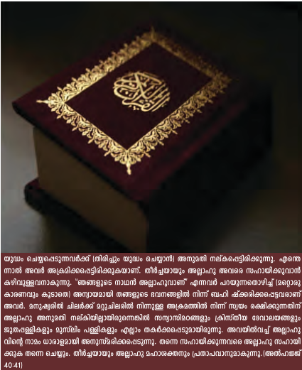
യുദ്ധം ചെയ്യപ്പെടുന്നവർക്ക് (തിരിച്ചും യുദ്ധം ചെയ്യാൻ) അനുമതി നൽകപ്പെട്ടിരിക്കുന്നു. എന്നാൽ അവർ അക്രമിക്കപ്പെട്ടിരിക്കുകയാണ്. തിരിച്ചുയുദ്ധം അല്ലാഹു അവരെ സഹായിക്കുവാൻ കഴിവുള്ളവനാകുന്നു. "അങ്ങളുടെ നാഥൻ അല്ലാഹുവാണ്" എന്നവർ പറയുന്നതാഴിച്ച് (അല്ലാഹു കാണലും കൂടാതെ) അനുമതിയില്ലാതെ തങ്ങളുടെ ദേഹങ്ങളിൽ നിന്ന് ബഹിഷ്കരിക്കപ്പെടലാണ് അവർ. മനുഷ്യരിൽ ചിലർക്ക് മറ്റുചിലരിൽ നിന്നുള്ള അക്രമത്തിൽ നിന്ന് സ്വയം രക്ഷിക്കുന്നതിന് അല്ലാഹു അനുമതി നൽകിയില്ലാത്തതുകൊണ്ട് സന്യാസികളെയും ക്രിസ്തീയ ദേവദൂതങ്ങളെയും അടങ്ങിക്കൊല്ലും മറ്റുമിടം പള്ളികളും എല്ലാം തകർക്കപ്പെടാതിട്ടും, അവയിൽനിന്ന് അല്ലാഹുവിന്റെ നാമം ധാരാളമായി അനുസ്മരിക്കപ്പെടുന്നു. അന്നേ സഹായിക്കുന്നവരെ അല്ലാഹു സഹായിക്കുക അന്നേ ചെയ്യും. തിരിച്ചുയുദ്ധം അല്ലാഹു മഹാകരേന്ദ്രം പ്രാപ്തമാക്കാവുന്നതുമാകുന്നു. (അൽഹജ് 40:41)

ജീവിതം അതിന് സാക്ഷിയാണ്. അവിടുത്തെ ആദ്യകാല ജീവിതം പരിശോധിച്ചാലറിയാം പ്രവാചകതത്തിന്റെ ആദ്യകാലങ്ങളിൽ തന്റെ ജന്മനഗരമായ മക്കയിൽ ഇസ്ലാമിന്റെ സ്നേഹത്തിന്റെയും സൗഹാർദത്തിന്റെയും സന്ദേശം മാത്രമാണ് എപ്പോഴും പ്രചരിപ്പിക്കാൻ ശ്രമിച്ചിരുന്നത്. എങ്കിലും മക്കക്കാർ അദ്ദേഹത്തെ നിരാകരിച്ചു എന്ന് മാത്രമല്ല റസൂൽ തിരുമേനി(സ)യോട് അവർ അങ്ങേയറ്റം ക്രൂരവും നിർദ്ദയവുമായ രീതിയിലുമാണ് പെരുമാറിയത്. അവിടുന്നും അവിടുത്തെ അനുചരന്മാരും അതിക്രൂരമായി മർദ്ദിക്കപ്പെട്ടു. അങ്ങനെ അവസാനം ദൈവത്തിന്റെ അറിയിപ്പിനാൽ റസൂൽ തിരുമേനി(സ) മക്കയിൽനിന്നും പലായനം ചെയ്ത് മദീന