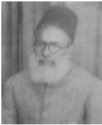
ഹ:മുഹമ്മദ് അബ്ദുസ്സമദ് ദഹ്ലവീ(റ)