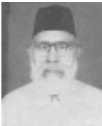
ഹ:ആഗാ മുഹമ്മദ് അബ്ദുല്ലാ (റ)