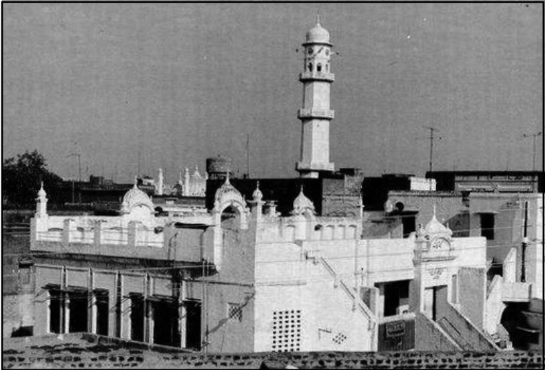
മിനാരത്തുൽ മസീദ് മസ്ജിദ് അഖ്സയും മസ്ജിദ് മുബാറകും അടങ്ങുന്ന ഒരു ദൃശ്യം