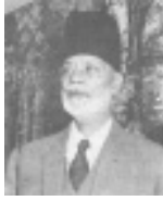
ഹ:ചൗധരി സർ മുഹമ്മദ് സഫറുള്ളാഹ് വാൻ(റ) (ഒന്നാമത്തെ പാക് വിഭജനകാല ചന്ദ്രിയം മുൻ ലോക കോടതി അധ്യക്ഷനാണ്)