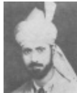
ഹ:സുഫി മുഹമ്മദ് റഫീഅ് (റ)