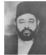
ഹ:മീർ മുഹമ്മദ് ഇസ്മായീൽ(റ)