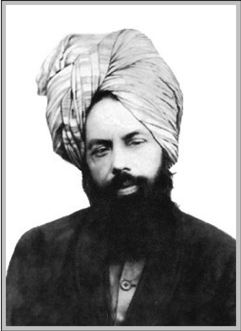
ഹദ്റത്ത് അഹ്മദ് (അ) വാഗ്ദത്ത മഹ്ദീ മസീഹ്