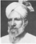
ഹ:സുഫി ഗുലാം മുഹമ്മദ് (റ)