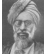
ഹ:മുഹിതി മുഹമ്മദ് സ്വാദിഖ്(റ) (കേരളം സന്ദർശിച്ചിട്ടു്)