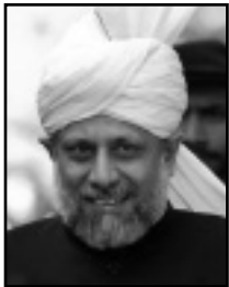
ഹ:മിർസാ മസ്ദൂർ അഹിമദ്ദി (അബ്ദുഹാജി) വലിഹത്തുൽ മസീഹി മൊമിൻ 2003*