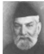
ഹ:മൗലാനാ സുൽഫിക്കർ അലി ഗൗഹർ(റ)