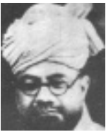
ഹ: മിർസാ ബശീർ അഹ്മദ്(റ) (ഹ. അഹ്മദ്(അ) ന്റെ പുത്രന്മാർ)