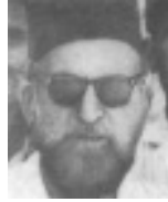
ഹ:സയ്യിദ് സയ്കുൽ ആബിദീൻ വലിയല്ലാഹ് ശാഹ് (റ)