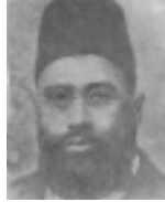
ഹ: ഡോ. ഖലീഫാ റശീദ്ജിൻ (റ) (ഹ. ഖലീഫത്തുൽ മസ്ലീം സാലിസ്(റഹ്) യുടെ മാതാപാത്ര)