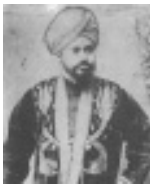
ഹ:നവാബ് മുഹമ്മദലി വാൻ(റ) (ഇന്ത്യൻ ഹ. മസ്ലിം മതമുഖലി അക്വെർ മുത്തമകൾ ഹ. നവാബ് മുബാറകാബായം സാഹിബ്. അയ്യൂബ് ദർത്താബാബ്)