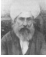
ഹ:സയ്യിദ് സർവർശാഹ് (റ)