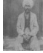
ഹ:ഹാജി മിനുൻബഖ്ശ് വുറൈശി ശഹീദ് (റ)