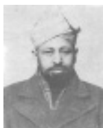
ഹ:മിർസാ ശരീഫ് അഹ്മദ്(റ)