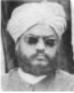
ഹ: മൗലാനാ അബ്ദുൽകരീം സിയാൽകോട്ടി (റ)