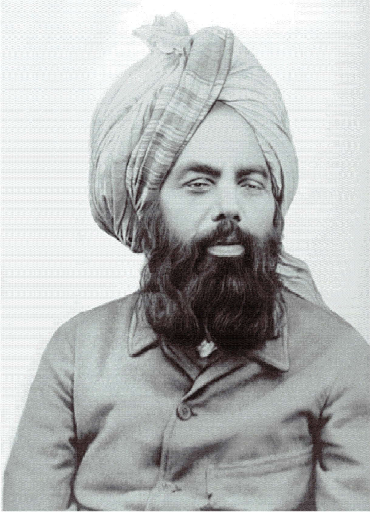
হজৰত মিৰ্জা গোলাম আহমদ কাদিয়ানী (আঃ) (১৮৩৫-১৯০৮)