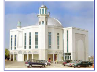
Baitul Futuh, London

വിവർത്തനം: ടി. അമീറുദ്ധീൻ സാജിദ് മുവാറ്റുപുഴ