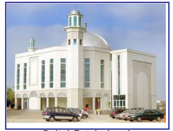
Baitul Futuh, London