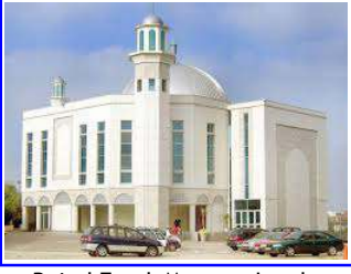
Baitul Futuh Mosque, London.