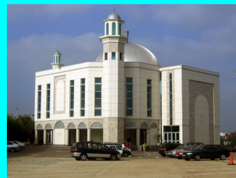
Baitul Futuh, London