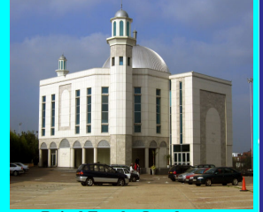
Baitul Futuh, London