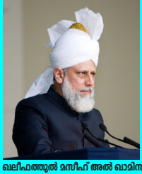
ഖലീഫത്തുൽ മസീഹ് അൽ ഖാമിസ്