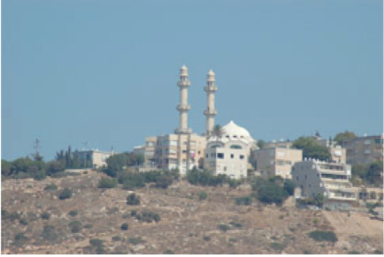
مسجد سیدنا محمود۔ حیفان۔ کبیر کا ایک خوبصورت منظر

کے فضل و کرم سے جماعتہائے بلاد عربیہ کو جنیل کرمل پر احمدیہ پریس قائم کرنے کی توفیق ملی ہے۔ مسجد سیدنا محمود اور مدرسہ احمدیہ کے افتتاح کے بعد احمدیہ لائبریری اور بکڈپو کا قیام نیز مرکز تبلیغ کا بننا مسرت انگیز امور ہیں۔ لیکن احمدیہ پریس کا قیام بھی از بس ضروری تھا۔ ہماری جماعت کی تعداد ابھی تھوڑی ہے، لیکن اللہ تعالیٰ کے فضل سے مخالفین پر ایک رعب ہے اسی کا نتیجہ ہے کہ مصر فلسطین شام اور عراق کے اخبارات ہماری مخالفت کرنا اور احمدیت سے لوگوں کو نفرت دلانا اپنا اہم ترین کارنامہ شمار کرتے ہیں۔ ان اخبارات کے اعتراضات کے جوابات، نیز سلسلہ تبلیغ کو باقاعدہ اور محکم کرنے کے لئے احمدیہ پریس کا ہونا بہت ضروری امر تھا۔ پھر سب سے بڑھ کر یہ کہ سیدنا حضرت مسیح موعود