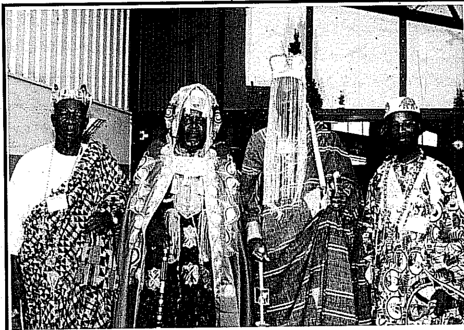
جلسہ جرمنی میں شامل ہونے والے تین احمدی مسلمان بادشاہ (دائیں سے بائیں) کنگ آف آلاڈا، کنگ آف پورا، کنگ آف نوگو

کل دنیا پر آشکار کرنے کا ذریعہ اس لہی جلسہ سالانہ کو بنا دیا۔ چنانچہ انگلستان کی سرزمین میں منعقد ہونے والے بعض انٹرنیشنل جلسہ ہائے سالانہ کی طرح اس سال جرمنی کی سرزمین پر منعقد ہونے والے جلسہ سالانہ میں بھی بعض افریقین ممالک کے تین بادشاہ اپنی بیگمات اور بعض مصاحبوں کی معیت میں شریک ہوئے۔ ان بادشاہوں میں بہین کے کنگ آف آلاڈا اور کنگ آف پورا کو نیز نوگو کے ایک بادشاہ شامل تھے۔ جب یہ بادشاہ جلسہ میں شمولیت کی سعادت حاصل کرنے کی غرض سے زرق برق لباسوں میں ملبوس موٹروں کے جلوس کی شکل میں اپنے اپنے علاقہ کے پاکستانی مبلغین کرام کی معیت میں اپنی قیام گاہ سے روانہ ہو کر ”مائی مارکیٹ“ کی وسیع و عریض حدود میں داخل ہوتے اور ان کا جلوس آہستہ آہستہ جلسہ گاہ کی طرف بڑھتا تو وہاں موجود ہزاروں ہزار احباب فرط مسرت سے جھوم اٹھتے اور وہ ہاتھ ہلا کر انہیں خوش آمدید کہتے۔ ان کی فرط مسرت کا باعث صرف یہ امر ہوتا کہ خدا تعالیٰ