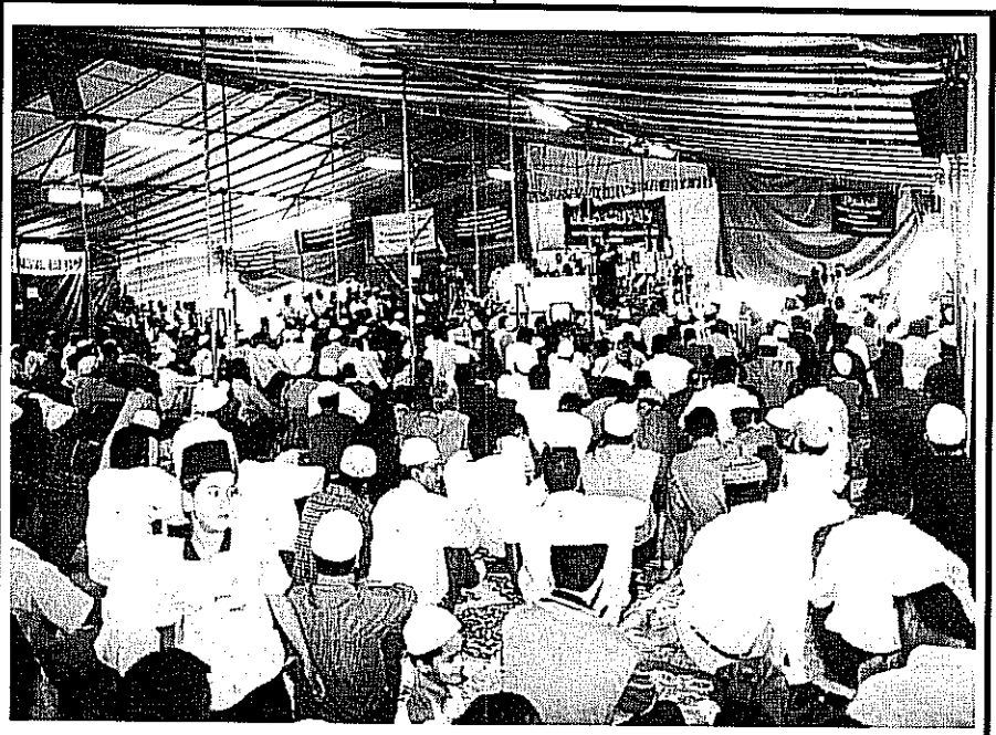
جلسہ سالانہ میں شامل شرکاء۔ ایک منظر

جماعت کو خلافت کے ساتھ مضبوط تعلق کے ساتھ خدائی وعدوں پر یقین رکھتے ہوئے۔